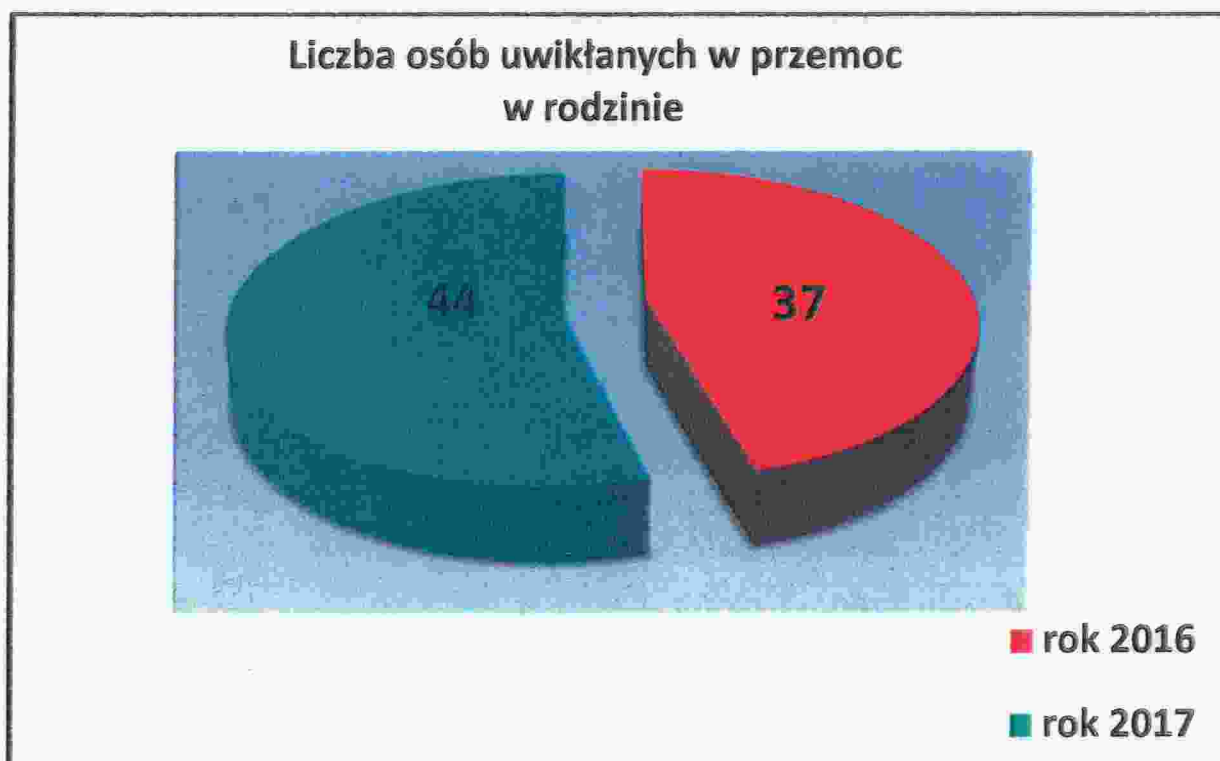
Wykres 2. Liczba osób uwiękanych w przemoc w rodzinie korzystających z pomocy w Ośrodku Interwencji Kryzysowej w Jaśle w latach 2016-2017